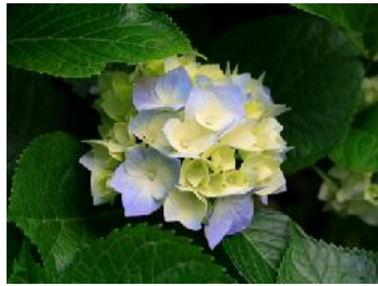
Gambar 1. Judul Gambar

Nomor dan judul tabel diletakkan di atas tabel yang bersangkutan. Tabel 1 menunjukkan contoh penulisan nomor dan judul tabel. Untuk memudahkan penomoran dan pemberian judul gambar serta tabel dapat digunakan fasilitas Caption. Warna pada gambar dan tabel akan diusahakan tetap dipertahankan pada prosiding dalam bentuk CD, namun untuk prosiding cetak hanya tersedia dalam format hitam-putih ( black and white ).