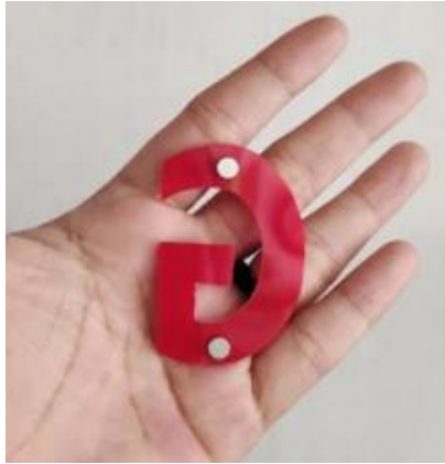
Gambar 2. Penempelan Magnet Pada Potongan Huruf