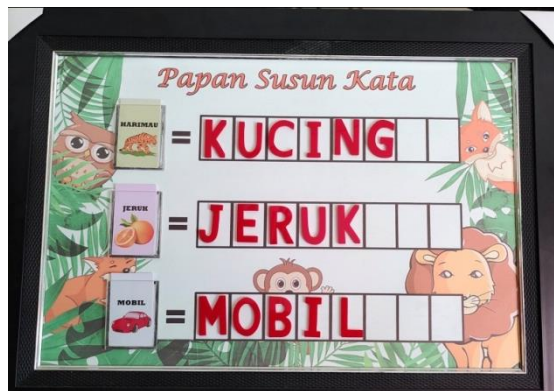
Gambar 3. Media Papan Susun Kata

Tahap akhir pembuatan media, yaitu menggabungkan semua bahan-bahan menjadi satu, seperti menempelkan stainless pada bingkai, memasukkan background dan menempelkan potongan huruf-huruf sesuai dengan gambar yang telah dicetak.