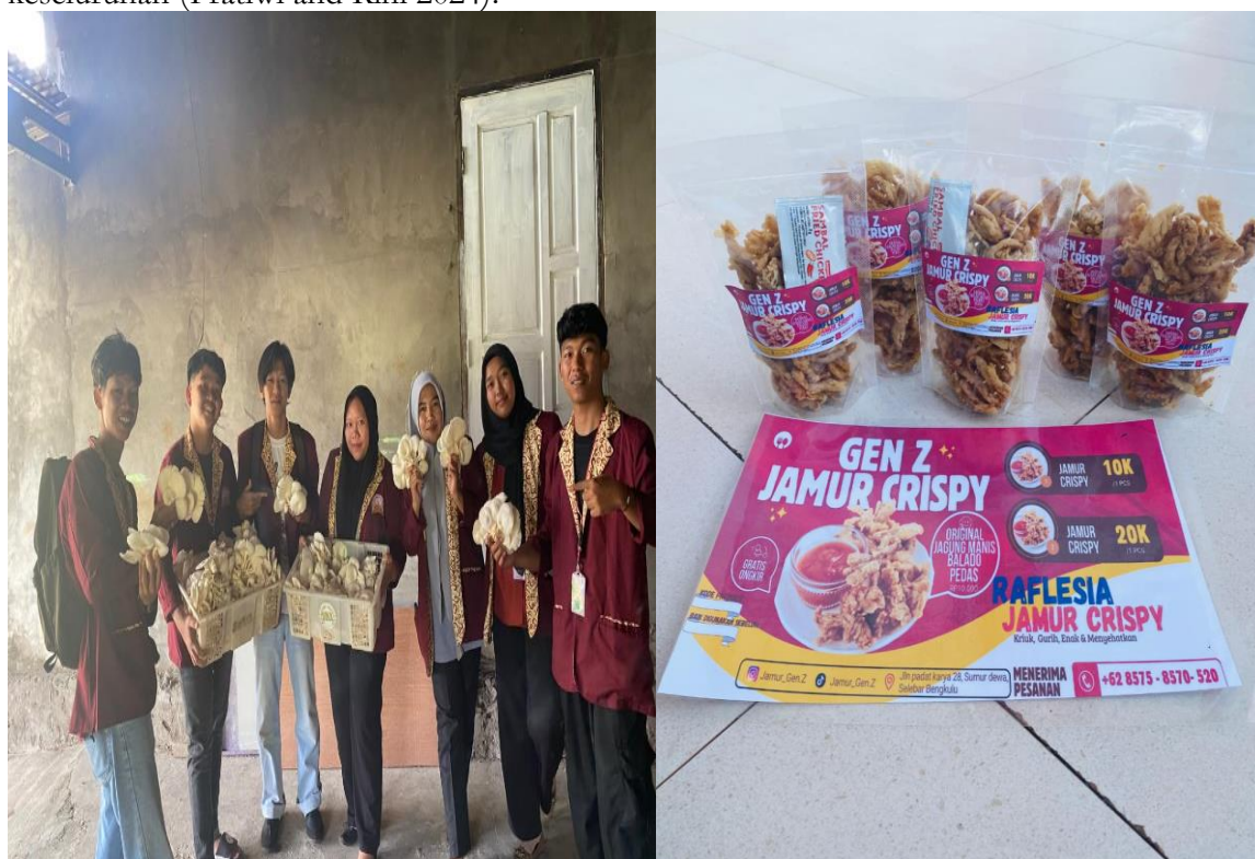
Gambar 1.3 inovasi produk baru dalam umkm jamur tiram raflesia

Dengan adanya inovasi produk ini, diharapkan UMKM Raflesia Jamur Bengkulu dapat mengembangkan produk baru yang tidak hanya kompetitif tetapi juga relevan dengan kebutuhan pasar yang ada. Pendekatan ini tidak hanya bertujuan untuk meningkatkan daya saing UMKM tetapi juga untuk memberdayakan mereka dengan pengetahuan dan keterampilan baru dalam menghadapi tantangan pasar yang kompleks dan dinamis. Melalui kolaborasi ini, diharapkan pemilik UMKM dapat mengimplementasikan ide-ide baru dan strategi inovatif dalam bisnis mereka, sehingga dapat mengoptimalkan potensi yang dimiliki dan memberikan kontribusi yang lebih besar terhadap pertumbuhan ekonomi lokal serta kesejahteraan masyarakat secara keseluruhan (Pratiwi and Rini 2024).