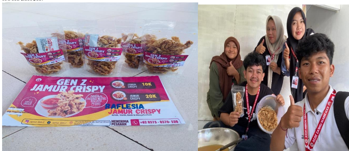
Gambar 1.1. Penempelan stiker dan pengeolahan jamur tiram raflesia

Dalam rangka meningkatkan daya saing produk, dilakukan implementasi penguatan branding melalui beberapa tahapan. Tahap awal diawali dengan identifikasi karakteristik produk serta penentuan nilai keunggulan (unique selling proposition) dari Jamur Tiram Raflesia (Budiman 2025). Selanjutnya dilakukan perancangan logo/ stiker sebagai identitas visual utama yang mencerminkan karakteristik produk. Di samping itu, dilakukan pula perbaikan pada aspek kemasan (packaging) melalui penambahan label atau stiker produk dan penambahan inovasi produk dengan membuat olahan Jamur Crispy yang lebih menarik dan informatif. Label tersebut mencantumkan informasi penting seperti nama produk, komposisi, serta kontak yang dapat dihubungi. Perbaikan ini memberikan kesan produk yang lebih profesional serta meningkatkan tingkat kepercayaan konsumen.