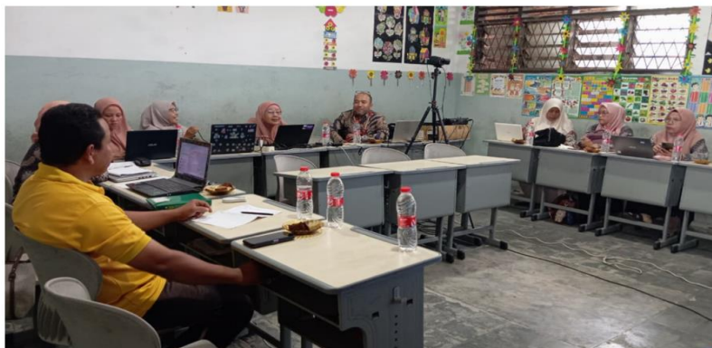
Gambar 2. Guru Berdiskusi pada Saat Kegiatan

Hasil diskusi memperlihatkan bahwa kegiatan ini berhasil memberikan penguatan pada aspek konseptual guru. Guru mulai mampu mengidentifikasi peluang integrasi nilai ekonomi syariah dalam pembelajaran literasi, seperti mengaitkan teks dengan nilai kejujuran, amanah, dan tanggung jawab. Namun demikian, ide-ide yang muncul masih berada pada tahap konseptual dan belum sepenuhnya berkembang menjadi perangkat pembelajaran yang sistematis. Hal ini menunjukkan bahwa kegiatan pengabdian berperan sebagai tahap penguatan dan pemantik ide awal, bukan tahap implementasi atau uji coba pembelajaran.