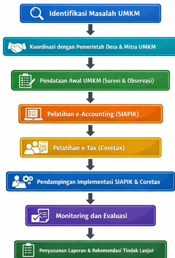
Gambar 1. Flowchart Metode Pelaksanaan Pengabdian Kepada Masyarakat

Tahap akhir dari kegiatan adalah evaluasi dan tindak lanjut. Evaluasi bertujuan untuk menilai sejauh mana program pengabdian mencapai tujuan yang telah ditetapkan, serta untuk mengidentifikasi area yang perlu perbaikan. Ini bisa dilakukan melalui survei, wawancara, atau diskusi kelompok terfokus (Meiliyadi et al. , 2024; Fitriyani & Rachmawati, 2023). Selanjutnya, tindak lanjut perlu direncanakan untuk memastikan keberlanjutan pembelajaran dan pengembangan kapasitas UMKM di masa depan, dengan potensi untuk mengadopsi skema pelatihan tambahan atau pengembangan jaringan usaha di antara sesama pelaku UMKM (Lapasisi et al. , 2023; Gunawan et al. , 2023).