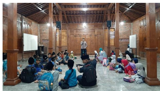
Gambar 4: Evaluasi pembelajaran mingguan

Pendampingan belajar dengan metode Iqro juga memberikan dampak positif pada keterampilan berbicara dan mendengarkan siswa. Selama sesi pembelajaran, siswa diajak untuk berdiskusi, bermain peran, dan menyampaikan pendapat mereka dengan jelas dan terstruktur. Mereka juga diajak untuk mendengarkan pendapat teman-teman mereka dengan baik dan menghargai keragaman pendapat. Hal ini tidak hanya meningkatkan kemampuan komunikasi siswa, tetapi juga membantu mereka untuk mengembangkan sikap empati dan kerjasama yang penting dalam kehidupan sosial.