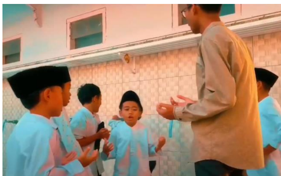
Gambar 3: Pembelajaran fiqh ibadah

Selanjutnya, hasil pembelajaran yang mencolok dari pendampingan belajar dengan metode Iqro adalah peningkatan motivasi belajar siswa. Sebagian besar siswa menunjukkan antusiasme yang tinggi dalam mengikuti setiap sesi pembelajaran dan aktif