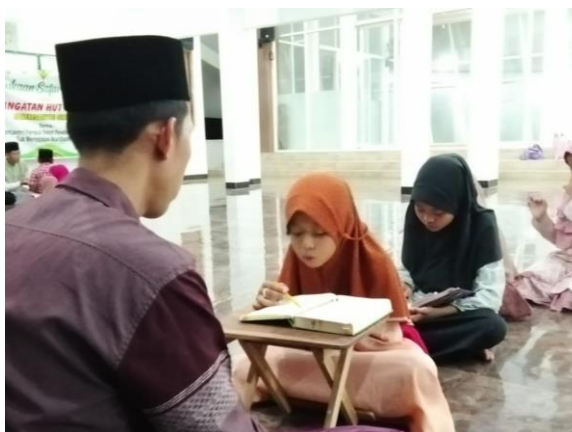
Gambar 2: Pendampingan individu metode iqro

Pertama, terdapat peningkatan yang signifikan dalam kemampuan membaca Al-Qur'an siswa setelah menjalani pendampingan belajar menggunakan metode Iqro. Sebelumnya, banyak siswa kesulitan mengenali huruf hijaiyah dan membaca Al-Qur'an dengan lancar. Namun, dengan pendekatan pembelajaran Iqro yang sistematis dan terstruktur, sebagian besar siswa berhasil membaca Al-Qur'an dengan lancar dan tepat. Mereka juga mampu menangkap makna ayat-ayat yang dibaca, yang terlihat dari kemampuan mereka menghubungkan ajaran Islam dengan situasi dalam kehidupan sehari-hari. Hal ini membuktikan bahwa metode Iqro efektif dalam membantu siswa mengembangkan keterampilan membaca Al-Qur'an secara bertahap dan terorganisir.