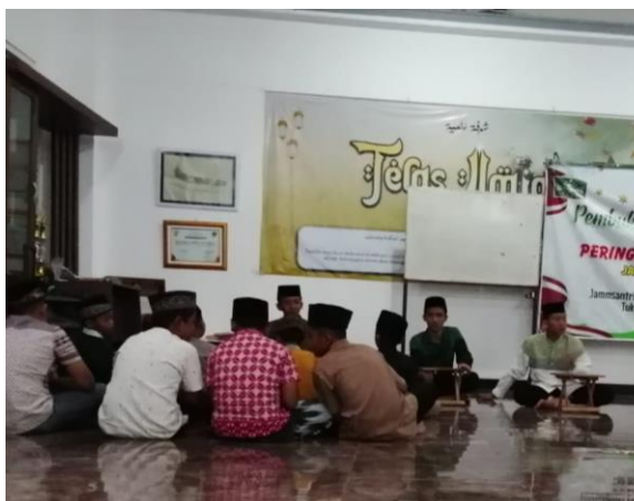
Gambar 1: Suasana pembelajaran iqro TPA Jannatul Firdaus

Pertama, terdapat peningkatan yang signifikan dalam kemampuan membaca Al-Qur'an siswa setelah menjalani pendampingan belajar menggunakan metode Iqro. Sebelumnya, banyak siswa kesulitan mengenali huruf hijaiyah dan membaca Al-Qur'an dengan lancar. Namun, dengan pendekatan pembelajaran Iqro yang sistematis dan terstruktur, sebagian besar siswa berhasil membaca Al-Qur'an dengan lancar dan tepat. Mereka juga mampu menangkap makna ayat-ayat yang dibaca, yang terlihat dari kemampuan mereka menghubungkan ajaran Islam dengan situasi dalam kehidupan sehari-hari. Hal ini membuktikan bahwa metode Iqro efektif dalam membantu siswa mengembangkan keterampilan membaca Al-Qur'an secara bertahap dan terorganisir.