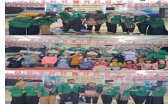
Dokumentasi usai pelaksanaan PKM