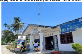
Dokumentasi Gambar Kantor Kepala Desa Gunung Seribu

Desa adalah kesatuan Masyarakat hukum yang memiliki batas wilayah yang berwenang untuk mengatur dan mengurus urusan pemerintahan, kepentingan masyarakat setempat berdasarkan prakarsa masyarakat, hak asal usul dan hak tradisional yang diakui dan dihormati dalam sistem pemerintahan Negara Kesatuan Republik Indonesia (NKRI). Berdasarkan hasil observasi yang telah dilakukan pada kegiatan pengabdian masyarakat Desa Gunung Seribu Kecamatan Gunung Meriah Kabupaten Deli Serdang, di mana desa ini masih dalam proses perkembangan desa yang memiliki sumber daya sosial yang baik, yang dapat dilihat dari aktifnya kegiatan-kegiatan seperti posyandu, senam pagi, kegiatan gotong-royong, dan lain-lain dan memiliki berbagai jenis sumber daya alam. Desa Gunung Seribu adalah salah satu desa dari 12 desa di Kecamatan Gunung Meriah. Desa Gunung Seribu berjarak 61 KM dari Universitas Muslim Nusantara Al-Washliyah. Desa Gunung Seribu berada di titik kordinat 3°10'81.300"N.98°70'05.017"E. Luas wilayah Desa Gunung Seribu adalah 800 Ha, dengan jumlah penduduk sebanyak 252 jiwa. Banyaknya desa dalam kecamatan Gunung Meriah, memberikan keberagaman dalam segi ekonomi, sosial dan sarana atau prasarana pendukung keberlanjutan desa.