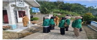
Dokumentasi Saat Apel Pagi di Kantor Desa Gunung Seribu

solidaritas dan silaturahmi bagi aparat desa dan masyarakat desa ini.