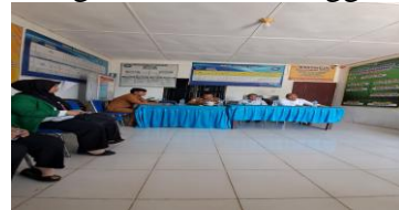
Dokumentasi saat diskusi oleh tim PKM