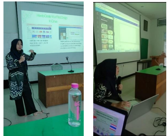
Gambar 3. Foto2 kegiatan